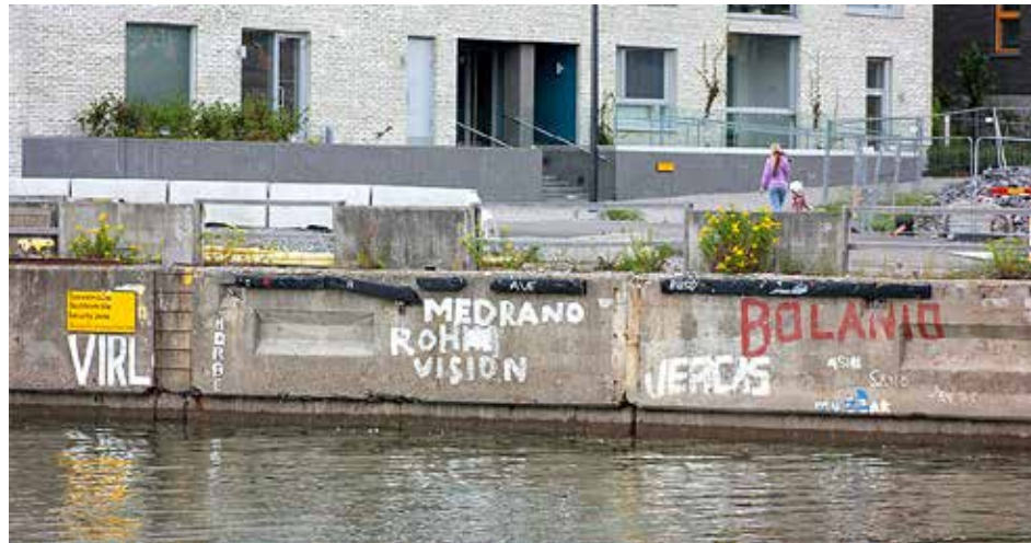
Merimiesten kirjoituksista Saukonlaiturissa (yllä) ainakin osa katoaa valliin puhkai- stavan kanavan kulkuaukon vuoksi. Ahdinaltaalla valli (alla) luultavasti puretaan kokonaan Hyväntoivonpuiston pätyyn tulevan uimarannan alta.

”Pitkä aallonmurtaja oli täynnä hienoja maalauksia laivoista. Ne olivat kuin taide- teoksia. Myös me maalasimme 1980-lu- vulla oman laivamme kuvan sapluunalla muuriin.”