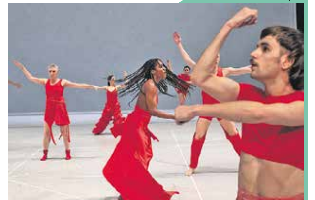
Any attempt will end in crushed bodies and shattered bones