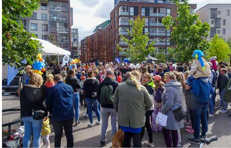
Juhlatunnelmaa viime vuoden Hyvän tuulen festissä.

Luvassa on muun muassa tietoa alueen hyvinvointi- ja liikuntapalveluista, ilmapalloja ja kivaa tekemistä. Mitä yllätyksiä laivavarustamoilta, K-kauppialta tai viltti-