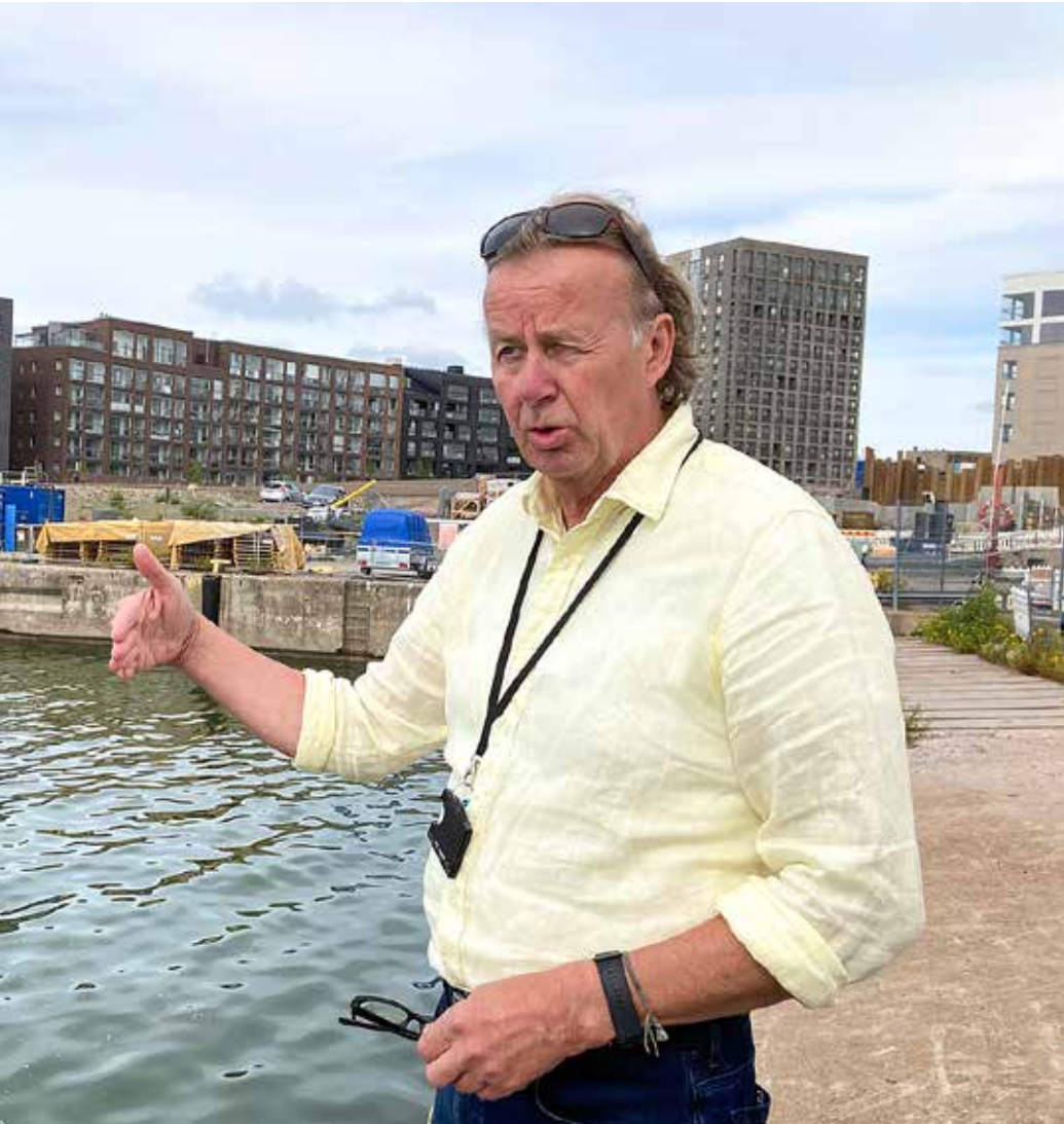
Kallio teki itsekkin nuorena merimiehenä tekstejä satamavalleihin ympäri maailman. Risteilyalusten merimiesten tekemiä ja vihreät ja muun väriset rahtilaivojen.”

tointi kuuluu kaupunginmuseolle. Nykydokumentointia on tehty jo vuodesta 1906, jolloin kaupungin vastaperustettu muinaismuistolautakunta palkkasi valokuvaaja Signe Branderin tallentamaan muuttuvaa Helsingiä.