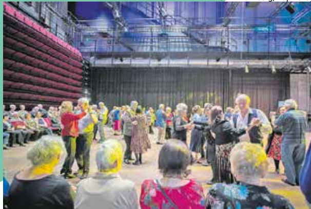
Lavatanssit Tanssin talolla