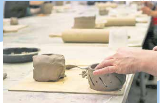
Työskentelyä Kädet saveen -työpajassa.

Kartonkigrafiikan kurssi on hieno mahdollisuus kokeilla syväpainografiikan tekniikkaa kierrätyskartongille, joka perinteisin menetelmin on työläs. Työpaja-ajan saa riittävästi paremmin, kun kuva-aiheen on mieltynyt valmiiksi. Virkistyspäivämaksuun sisältyy opetus sekä kaikki tarvittavat materiaalit ja työvälineet. Työt voi ottaa päivän päätteeksi mukaan tai noutaa myöhemmin. Hinta 510 €/ryhmä + materiaalimaksu 15 €/henkilö (hinta sisältää alv 25,5 %).