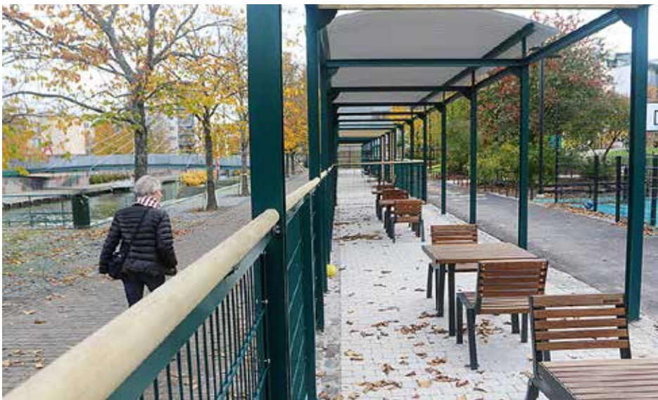
Leikkipuistoa uusittaessa kunnostettiin myös Ruoholahden kanavan puolen aitaus ja pergola. Puistoon asennettiin pöytiä ja tuoleja eväshetkiä varten.