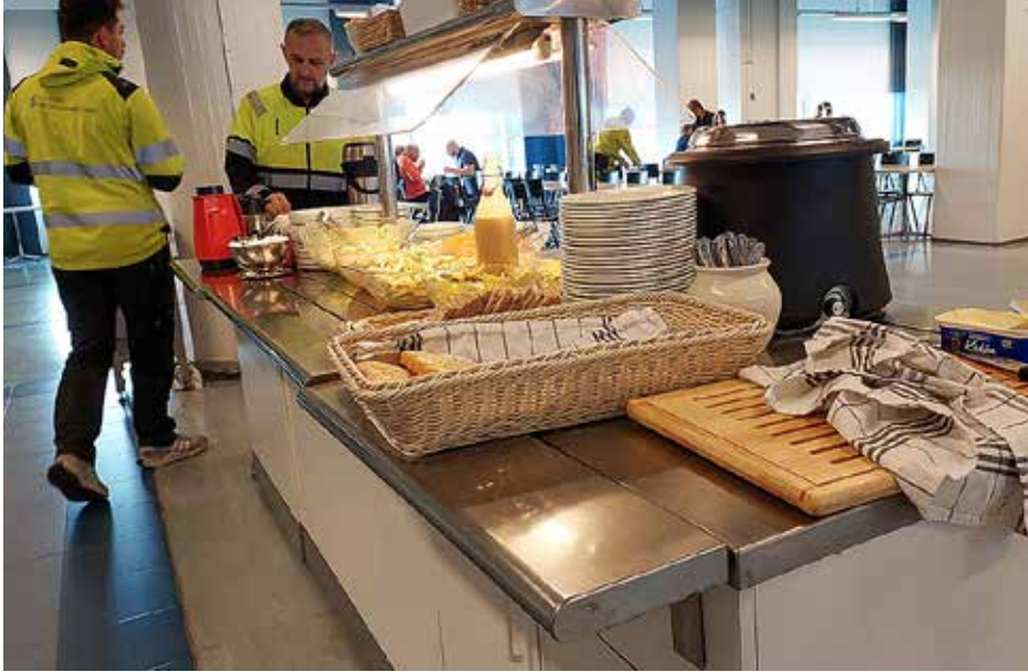
Lounasravintola Murtajan salaattipöytä. Kaikille avoimelle puolelle mahtuu kerralla noin sata ruokailijaa.