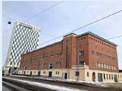
L2-makasiini on nykyään osa Clarion-hotellia. Hotellirakennus näkyy taustalla.