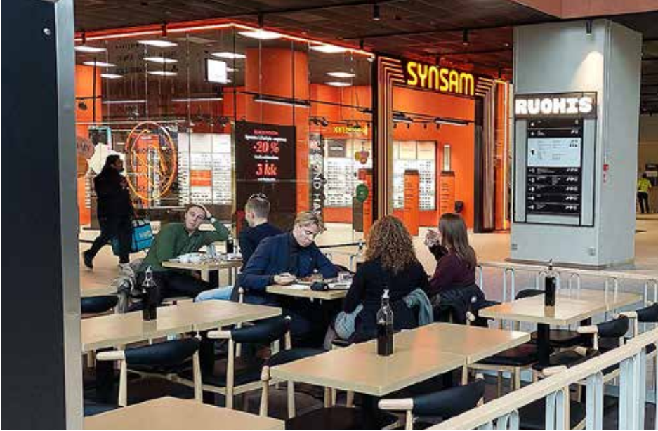
Korttelikeskus Ruohis uudistui vuonna 2025 nimeä myöten.