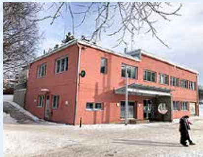
Ruoholahden nuorisotalo Koralli sijaitsee Jätkäsaarella Messityönkadulla.