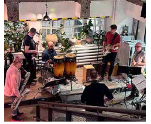
Soittajat vauhdissa helmikuussa 2026 Kaapelitehtaan Kahvibaarissa järjestettävässä After work -jamissa.