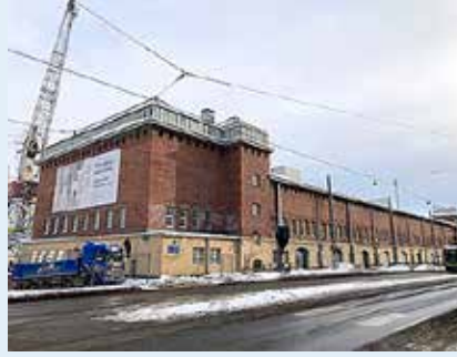
L3-makasiini Tyynenmerenkadulla on alueen vanhin rakennus, vuodelta 1924.