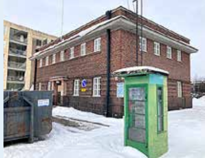
Sonckin talo ja puhelinkoppi Laivapojanaukiolla Välimerenkadun varrella.