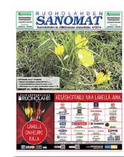
Lehden kansi huhtikuussa 2016.

Artikkelissa käsiteltiin Hernesaaren uutta risteilylaituria, joka valmistui vuonna 2018. Kyseinen laiturin korvasi Jätkäsaaren Melkinlaiturin. Nyt vuonna 2026 Mel-