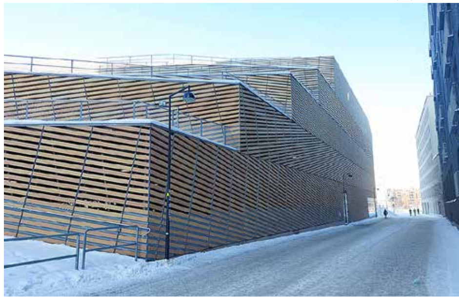
Pysäköintitalo Saukonlaituri helmikuussa 2026.

Adressissa vaaditaan, että kaupunki ryhtyy tarvittaviin toimenpiteisiin pysäköintitalon katon turvallisuuden parantamiseksi.