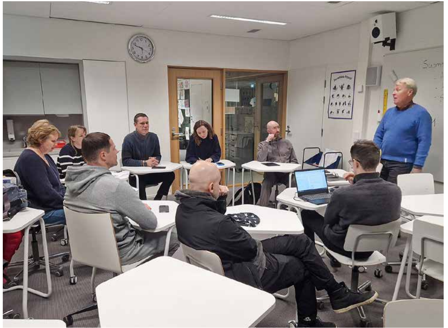
Jätkäsaaren kielikerho kokoontuu kerran viikossa keskiviikkoisin Jätkäsaaren koululla. Aloittelija- ja keskitason ryhmissä käytetään Toisto-materiaaleja.

”Opiskelin kursseilla Aalto yliopistossa, kävin myös intensiivikursseilla Helsingin kesäyliopistossa. Nykyään tulen kielikerhoon, koska luulen olevani aika