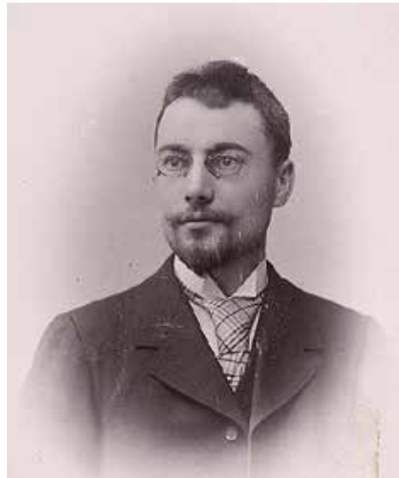
Arkkitehti Lars Sonck suunnitteli monia taloja Helsinkiin.

1935 valmistunut makasiini L2 toimii hotelli Clarionin kongressikeskuksena. Rakennuksen ja tontin omistaa norjalainen Petter Stordalen Strawberry-yhtiöineen.