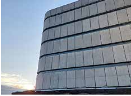
Bunkkeri vuonna 2023.