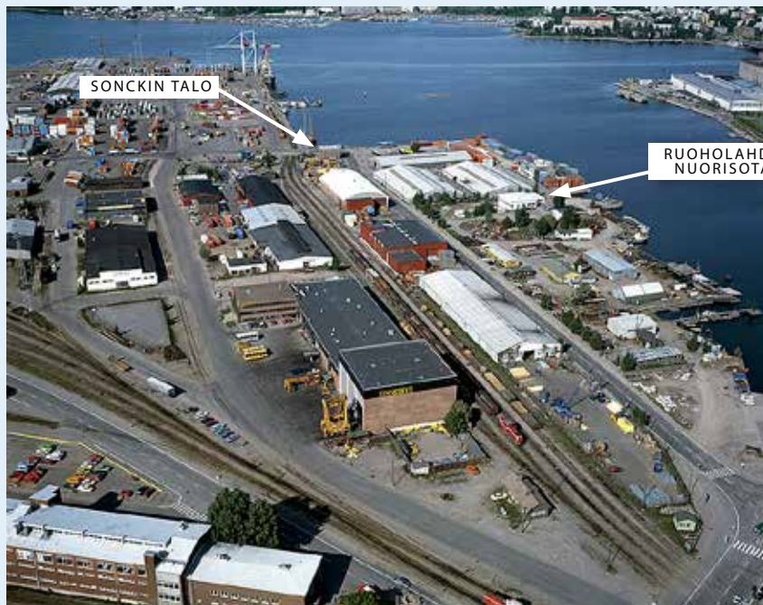
Jätkäsaari 1980-luvulla. Junaraiteet olivat aktiivisessa käytössä. Kuvan alalaidassa on Huutokonttori ja sen viereinen Jätkäsaaren pelastusasema. Sonckin talo sekä kuvanottohetkellä valkoinen Ruoholahden nuorisotalo näkyvät kuvassa myös.