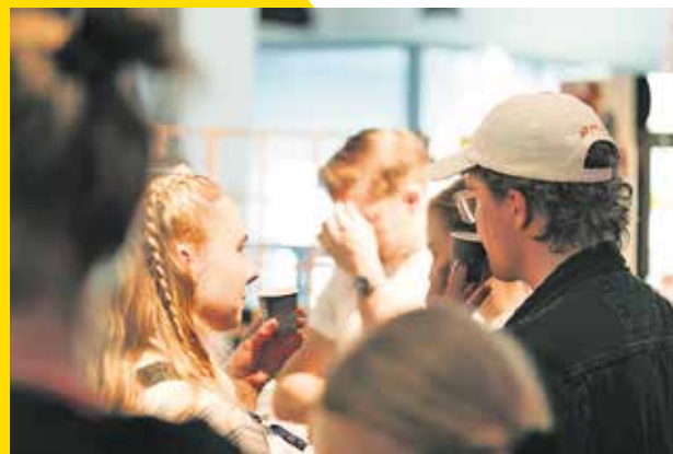
Helsinki Coffee Festival

Tapahtuma tarjoaa myös mahdollisuuden pysähtyä hetkeksi kiireen keskellä. Maistelu, keskustelut ja uudet löydöt tekevät viikonlopusta inspiroivan kokonaisuuden, jossa yhdistyvät laatu, käsityö ja ajankohtaiset makusuunnat. Kaapelitehtaan sijainti Ruoholahdessa tekee tapahtumasta helposti saavutettavan ja vaivattoman osan keväistä kaupunkiviikonloppua.