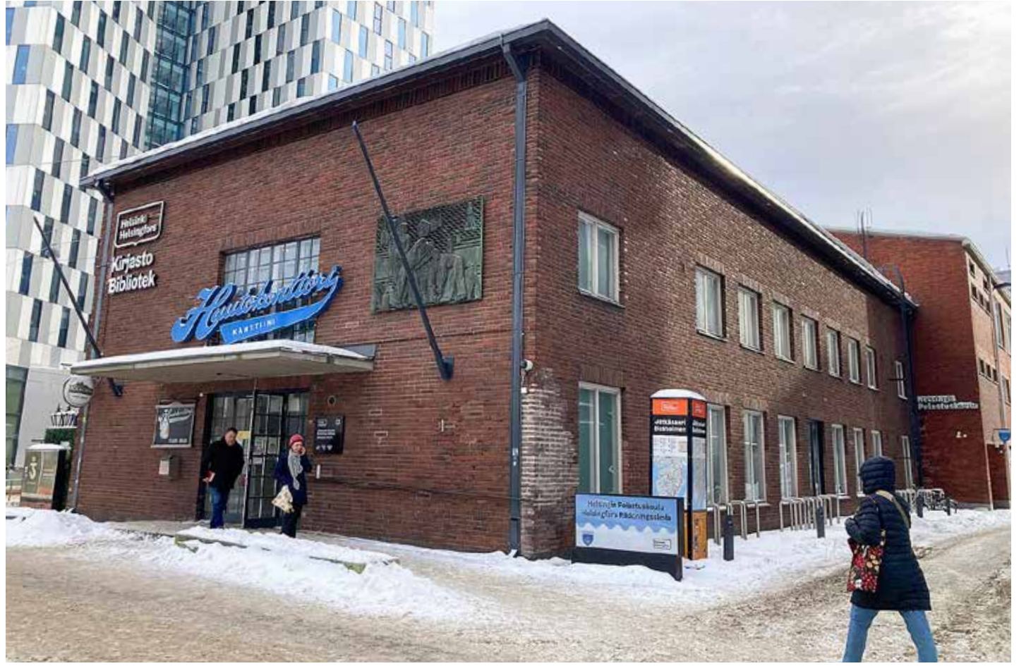
Huutokonttorissa huudettiin 1940-luvulla ja nykyään tiloissa on kirjasto ja ravintola.

SONCKIN MAKASIINIT eli satamavarastot L3 ja L2 rakennettiin Jätkäsaaren itärannalle eli kaupungin puolelle 1920–1930-luvuilla. Tänäpäin molemmat rakennukset ovat suojeltu asemakaavassa. Tyynenmerenkadulla sijaitseva vuonna